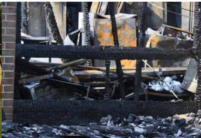
Unser Lagerraum nach den Löscharbeiten.