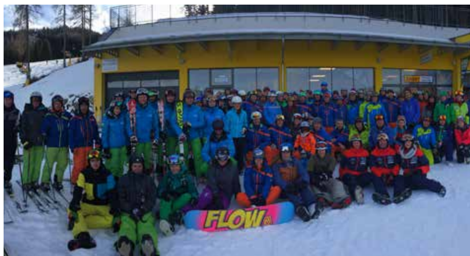
Ausbildungsoffensive der Naturfreunde Steiermark