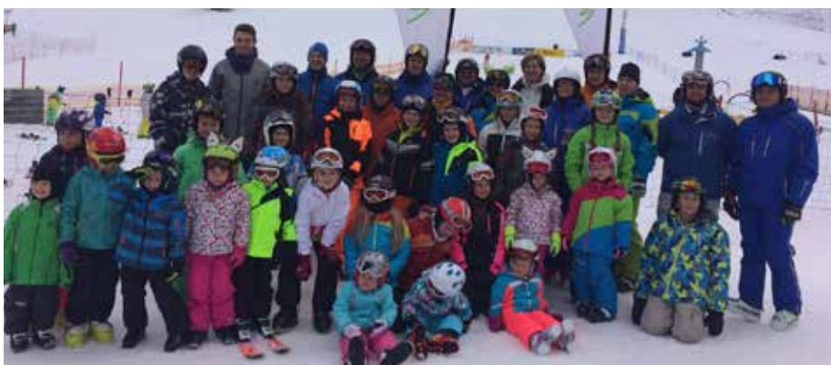
Die Teilnehmer der OG Gratkorn an den Ski- und Snowboardkursen.