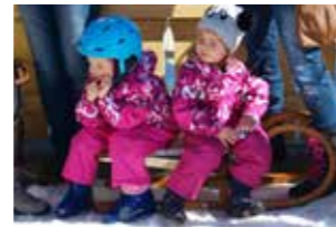
3. Platz OG Mitterdorf ex aequo OG Weiz