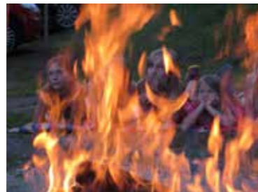
1. Platz OG Pöls