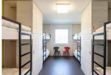
Sechs- und Achtbett-Apartements mit Küche, Achtbettzimmer, Doppelzimmer und Schlafstudios