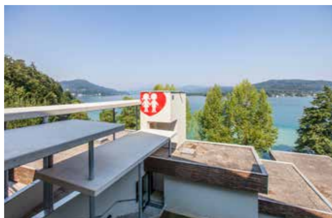
Traumhafte Lage mit direktem Seeszugang

Gerne erstellen wir Ihnen ein Angebot auf Basis Ihrer individuellen Wünsche und Erfordernisse: Tel. 0316/825512, 0664 8055327 sekirn@kinderfreunde-steiermark.at Süduferstraße 90 9081 Reifnitz