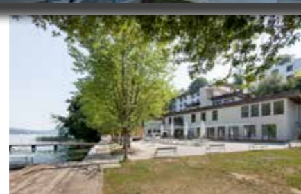
Stege, Liegewiese, Beachvolleyballplatz