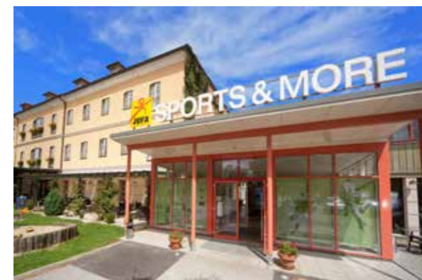
JUFA Familienhotel mit einem Einblick in eines der Zimmer!

Dieser Rabatt ist nur für die Mitglieder der Naturfreunde Steiermark gültig. Damit der Rabatt berücksichtigt werden kann, bitten wir Sie bei der Anreise Ihren Naturfreunde Mitgliedsausweis vorzuweisen. Messe & Eventtermine sind von der Rabattierung ausgeschlossen. Gutscheine sind für den Reisezeitraum von 01.01. bis 31.12.2016 gültig!