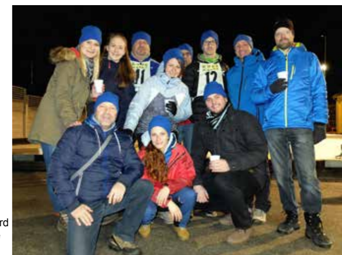
Die zwei Moarschaften vom Referat Ski Alpin/Snowboard der OG Zeltweg mit ihrem jungen Team erreichten die Plätze 5 und 6.