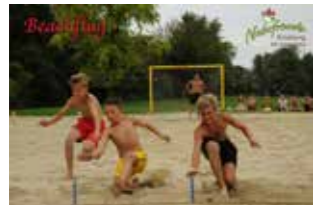
2. Platz OG Kindberg