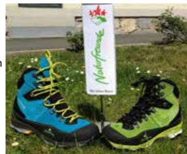
Gewinne deinen Naturfreunde-Bergschuh!

In Kooperation mit der Firma Dachstein gibt es seit kurzem einen Schuh dieses Unternehmens mit dem Naturfreunde-Logo. Der Dachstein „Preber“ ist ein leichter Bergschuh, der trotzdem mit einer Vibram-Sohle ausgestattet und durch seine Membran wasserdicht und atmungsaktiv ist. Für Naturfreundemitglieder gibt es den Schuh um sensationelle € 139,- statt um € 179,- im Fachhandel. Im Rahmen eines tollen Gewinnspieles für alle steirischen Naturfreunde wird diesmal unter allen Mitgliedern, die bis 15. April eine E-Mail mit Namen und Mitgliedsnummer an die Landesorganisation (mail@naturfreunde-stmk.at) senden, ein Paar Naturfreundeschuhe verlost! Die Gewinner werden von der Landesorganisation verständigt.